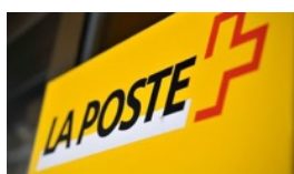
POUR UN SERVICE PUBLIC FORT ET DE PROXIMITÉ